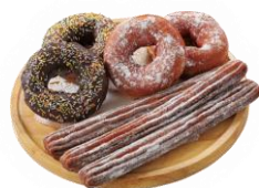
「Doona PON!」 のドーナツ