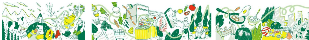
コンセプトグラフィック「Well-being Journey」

「新鮮・おいしい・健康」、「人や地域とのつながり」、「居心地の良いほっとする場」を感じられる店舗づくりを目指しました。木目調の内装を取り入れた店内に加え、従業員休憩室の備品などにも、快適に過ごせる工夫を施しています。