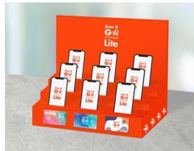
<Scan & Go Lite の端末>