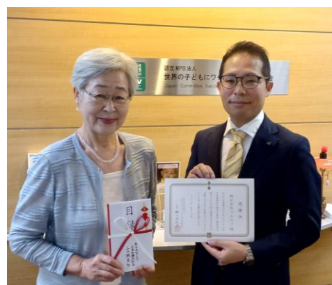
認定NPO法人 世界の子どもにワクチンを 日本委員会 (JCV) での贈呈式の様子

当社は、世界の子どもたちが健康で豊かに暮らせる環境づくりに貢献するとともに、未来を担う子どもたちの健やかな成長と持続可能な社会の実現を願い、今後も、お客さまとともにこの活動を続けてまいります。