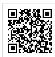
Tサイト(Tポイント募金) マルエツ×むすびえ 「子ども食堂」応援募金