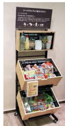
当社オリジナルの 食品寄付ボックス