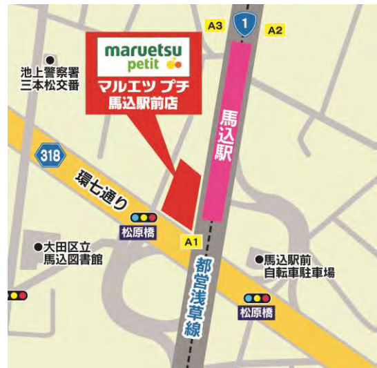
都営地下鉄浅草線「馬込駅」A1出入口徒歩1分

人口:6,467人、世帯数:3,895世帯 世帯伸長率:99.8%(21/20年対比) 世帯当り平均人員:1.66人 世帯人員比率: 大田区と比較して、1人世帯が56.9%と5.9%高く、2人世帯が20.6%、3人世帯が12.1%、4人以上世帯が10.3%とそれぞれ1.8%、1.9%、2.3%低い地域となっています。 年齢別人口構成比: 大田区と比較して、25歳～44歳が34.6%と3.6%高く、0～14歳が9.6%、55歳以上が31.1%とそれぞれ1.3%、2.6%低い地域となっています。