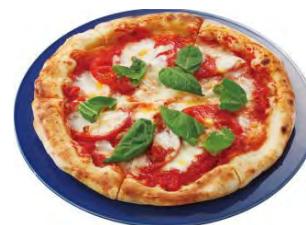
フレッシュマトのマルゲリータ