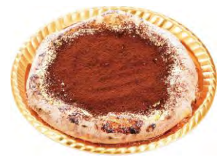
ティラミス風ピッツァ