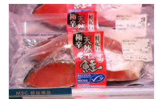
MSC認証商品の塩紅鮭