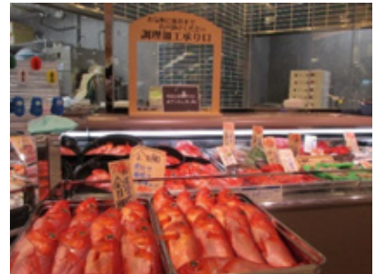
※画像はイメージです

お野菜・果物売場では地元農家から朝採れの新鮮な旬の野菜、産地や品種にこだわった旬の果物を、お魚売場ではお客さまと会話を交わしながら楽しく選べる対面販売を実施し、漁港直送の鮮魚や貝類をご紹介いたします。