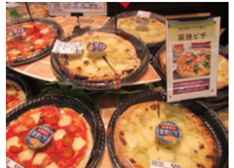
※画像はイメージです

鮮魚「魚季」売場ではネタとシャリにこだわった鮮魚鮓に加え、旬魚を中心としたおいしい惣菜を、お惣菜売場では、旬の野菜や拘りのお肉を店内で加工・調理し、出来立てアツアツの美味しいお惣菜として提供し、お客さまの楽しい食卓を演出いたします。