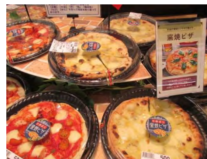
※画像はイメージです