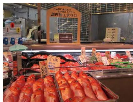
※画像はイメージです

お野菜・果物売場では地元農家から朝採れの新鮮な旬の野菜、産地や品種にこだわった果物を、お魚売場ではお客さまとの会話を通しての対面販売を実施し、漁港直送の鮮魚や貝類を品揃え豊富にご用意いたします。