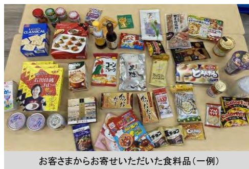
お客さまからお寄せいただいた食料品(一例)