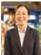
2016年5月には女性初の執行役員が誕生

2007年6月に「女性かがやき委員会」を発足。また、女性の能力開発、管理職の育成・登用を目的に、育成者の選抜や管理職としての知識・スキルを習得するための教育研修を継続しています。5月には初の女性執行役員が誕生しています。