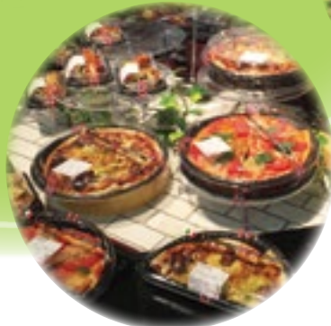
マックスバリュおゆみ野店