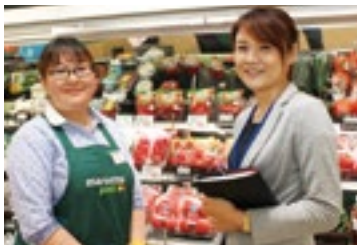
女性活躍推進室長(右)と店長JOB(左)

マルエツは2016年3月、女性活躍推進法への対応と、女性が十分に能力を発揮し活躍できる環境を整備するため、人事部に「女性活躍推進室」を新設。女性の管理職への積極的な登用をはじめ、職場環境・働き方の改善などを推進していきます。