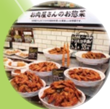
マルエツ八千代中央駅前店