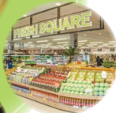
フードスクエアカスミひたちなか笹野店