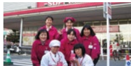
活動の主役は女性パート社員

マックスバリュ関東では、地域の生活者としてお客さまのニーズに敏感な女性のパート社員を中心に、お客さまに支持される店舗づくりを目指す「マイストア活動」を各店舗で実施。イベントを通じた交流や地元ならではの品揃えなどを行い、好評を得ています。